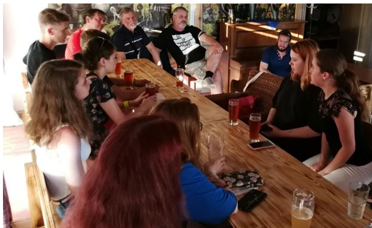
Ukrajinskí študenti na diskusii vo Veľkom Krtíši.

Máme to aj na Slovensku, kde niektorí isté skupiny ľudí označujú za potkanov, švábov či parazitov. Treba povedať, že vo vojne to má aj svoju druhú stranu. Pre Chorvátov boli Srbi „četnici“, Ukrajinci označujú Rusov z Ruska ako „svoloč“. A posielajú ich kamkoľvek. Zlo plodí zlo.