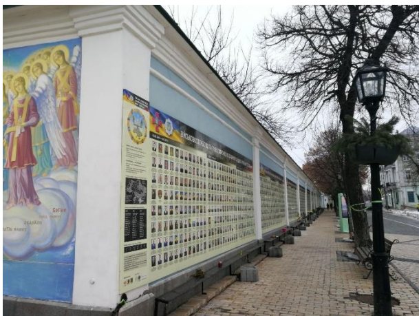
Múr padlých za Ukrajinu v rokoch 2014 až 2020 v Kyjeve.

Ja som ich najvýraznejšie zaznamenal po majstrovstvách Európy vo futbale, ktoré sa na Ukrajine konali v roku 2012. Vtedy sa tá krajina doslova otvorila. Zrazu akoby som chodil do úplne inej Ukrajiny.