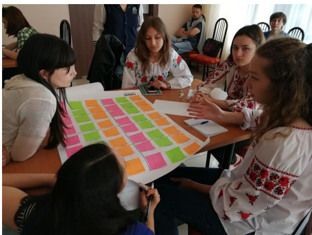
Ukrajinské študentky na seminári v Poltave.

Iný krásny príklad – s Oxanou sme šli v Záporoží do obchodu a predavačka ju prosila, aby ešte niečo povedala v ukrajinčine, že takúto krásnu ukrajinčinu dávno nepočula. Všetko toto sú jasné dôkazy, že ľudia medzi sebou nemajú žiadny problém, že Putin si ho vymyslel. Za 12 rokov som prešiel celú Ukrajinu, a tak to viem potvrdiť. Je mi strašne, keď si čítam a počujem, kde všade dnes bombardujú našich kamarátov a naše kamarátky.